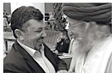
С представителем ДУМ Азербайджана