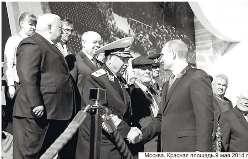
Москва. Красная площадь. 9 мая 2014 г.

Уважаемый муфтий! Поздравляю Вас с Днем Победы! Все дальше в историю уходит победная весна сорок пятого. Но память о великом подвиге нашего народа не меркнет с годами. Она передается из поколения в поколение, помогает выстоять в любых испытаниях, вдохновляет на новые свершения. Желаю Вам успехов в делах и всего самого доброго! В.Путин