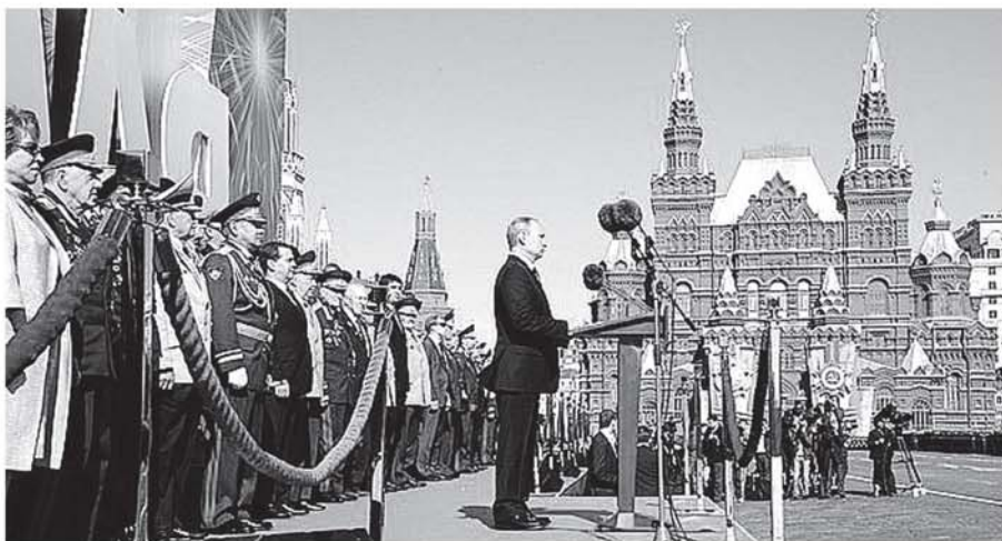
Выступление Владимира Владимировича Путина на военном параде в ознаменование 69-й годовщины Победы в Великой Отечественной войне

Уважаемые граждане России! Дорогие ветераны!