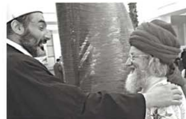
С муфтием Сербии Мухаммад Юсуфспахичом