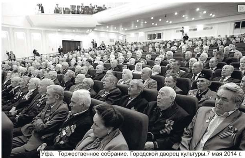
Уфа. Торжественное собрание. Городской дворец культуры. 7 мая 2014 г.