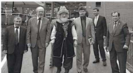
С муфтием Стамбула Рахми Яраном