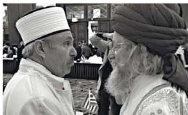
С муфтием Греции Яшар Шариф Дамадоглу