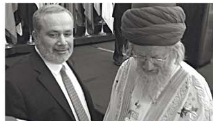
С министром вакуфов Иордании