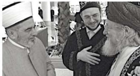
С муфтием Украины Ахмад Тамимом