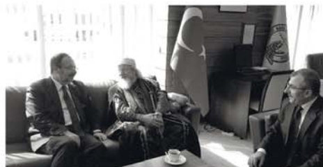
С начальником управления по делам религии Турции Мехмед Гурмезом