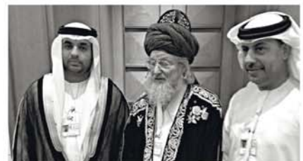
С делегацией из ОАЭ