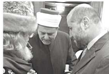
С министром вакуфов Палестины Мохмуд аль-Хабаш