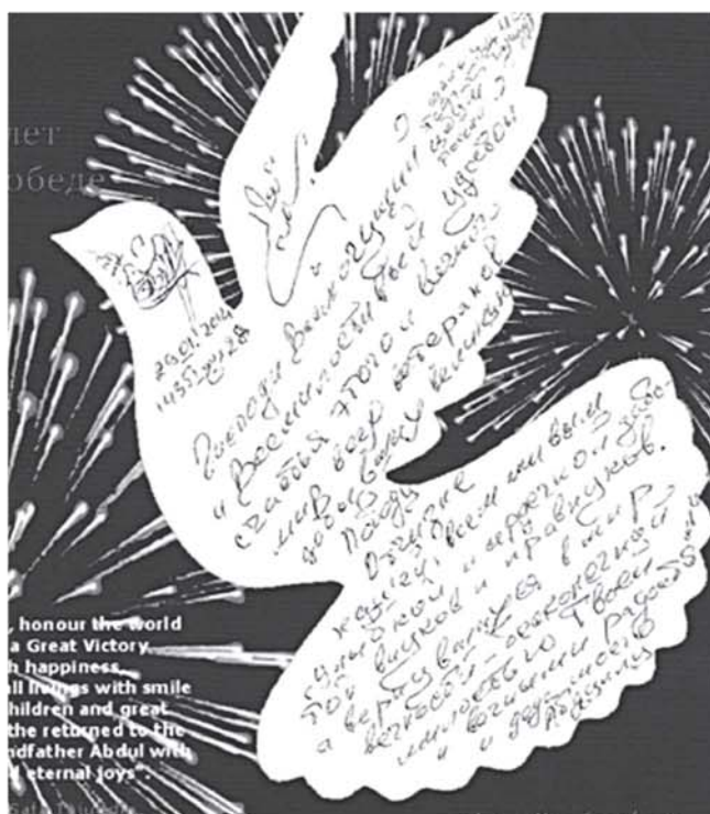
Шейхуль-ислам Талгат Таджуддин - один из тех, кому было предложено написать пожелание ветеранам Великой Отечественной войны.

Господь Всемогущий и Всемилостивый, удостой счастья этого и вечного мира всех ветеранов, добывших великую Победу Отчизне