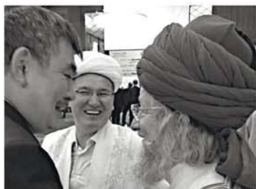
С ректором исламского университета Казахстана