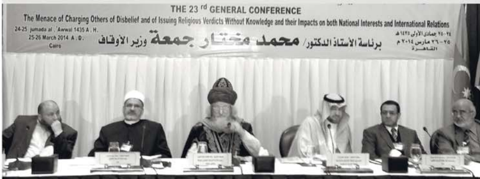
Во время выступления Верховного муфтия на конференции

Верховный муфтий, шейхуль-Ислам, Председатель ЦДУМ России Талгат Сафа Таджуддин представлял Российскую Федерацию на состоявшемся 29 марта в Каире исламском форуме, в котором участвовало свыше 70 стран. Организатором выступили Министерство Вакуфов и Высший Совет по делам Ислама Египта.