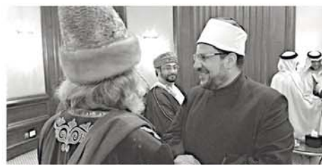
С министром вакуфов Египта Мухаммад Мухтар Жумга