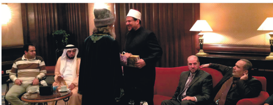
Вручение подарка министру по делам религии Египта от имени делегации ЦДУМ России